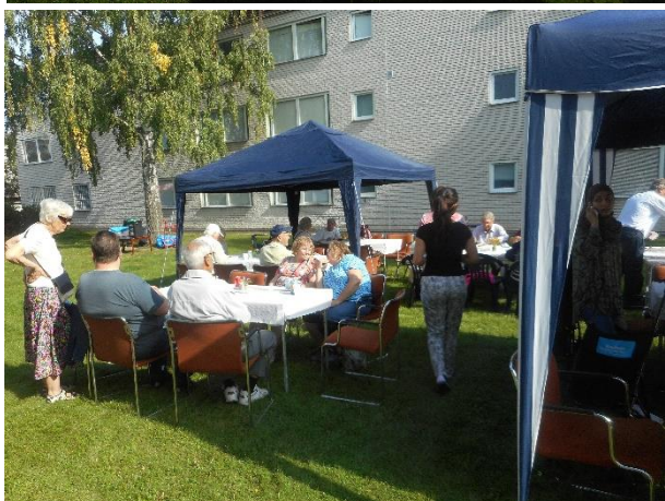
Riksbyggen bjöd på tårta.