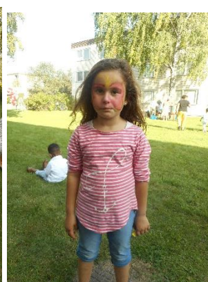
Ansiktsmålning och fiskdamm till våra yngsta deltagare.