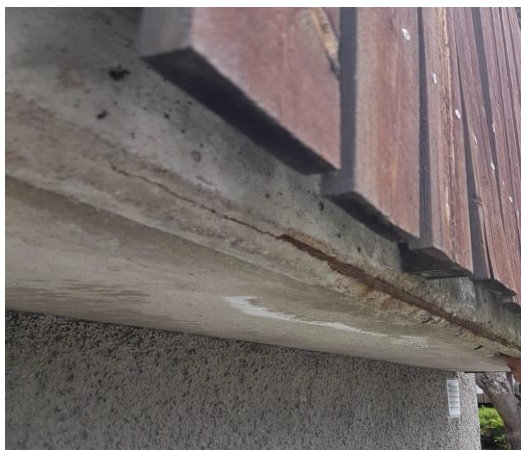
Exempel på rostigt armeringsjärn som tittar fram.